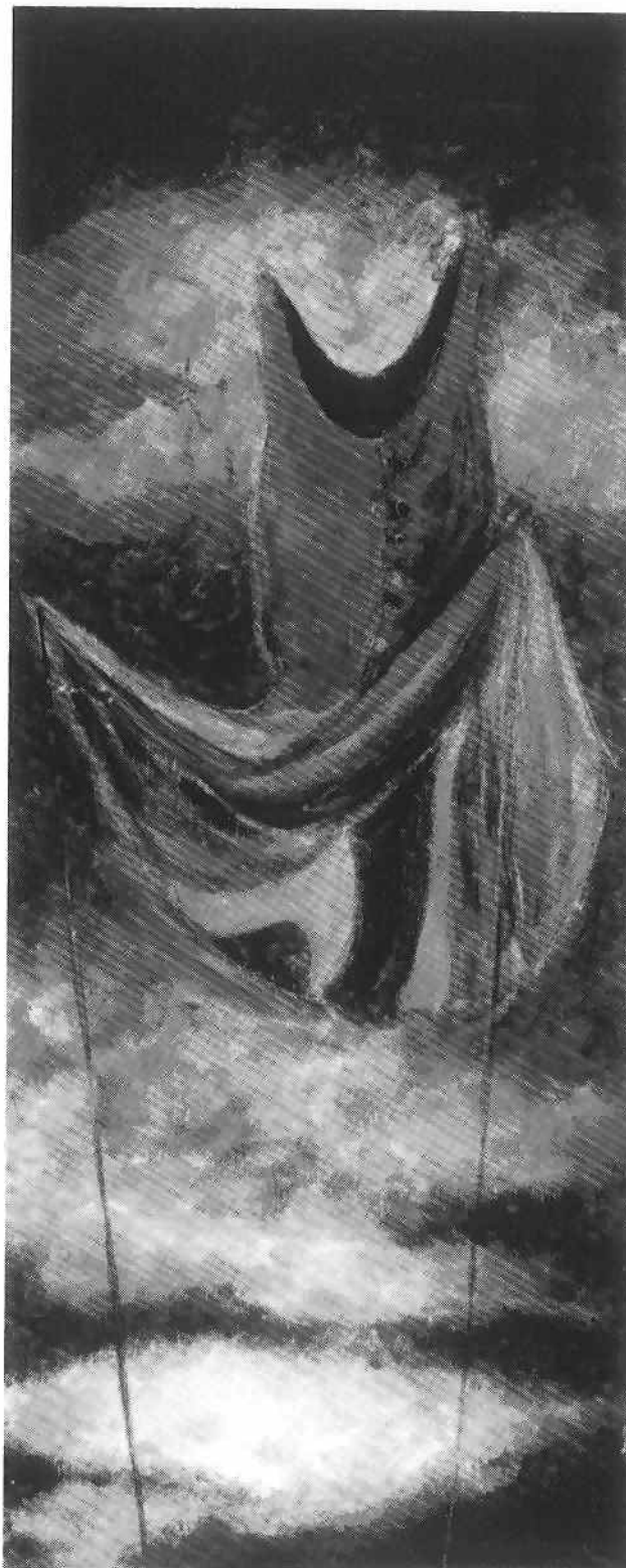
Sophie Lancôt, Drape , 1995. Tempera sur bois; 37 x 15 cm.

n'importe quel retour ! L'art le plus bas dans la hiérarchie des genres nous dit sa marginalité et la limite du pouvoir des genres nobles. La marge est toujours le lieu où la norme risque de se court-circuiter.